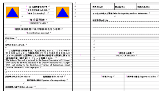
(国民保護措置に係る職務等を行う者用の身分証明書のひな型)