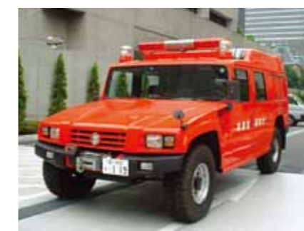
Command support vehicle 指揮支援車