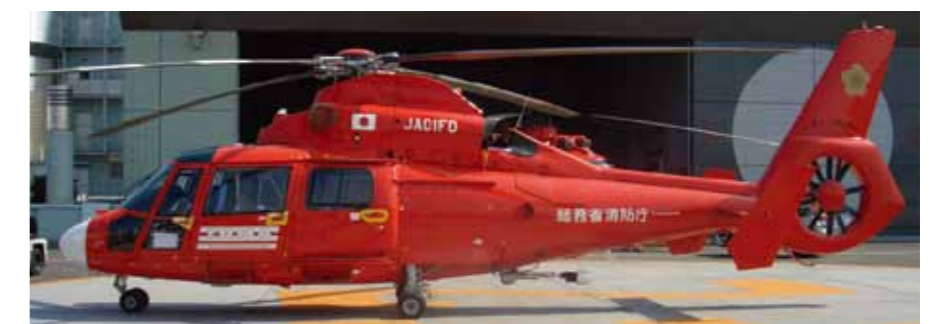
FDMA helicopter 消防庁ヘリコプター