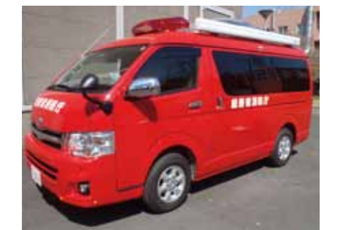
Satellite communication vehicle 衛星車載局車