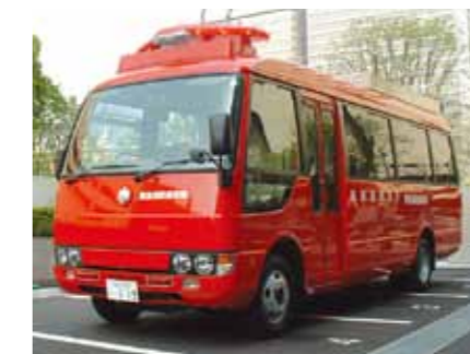
Personnel transport vehicle 人員搬送車