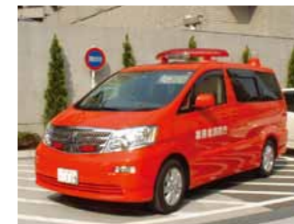
Command vehicle 指揮車