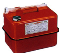
ガソリンの貯蔵に適した容器の例 (金属製容器であることが必要)