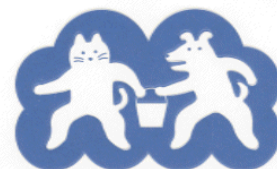
防災まちづくり大賞シンボルマーク

http://www.isad.or.jp/ http://www.jubo.go.jp/