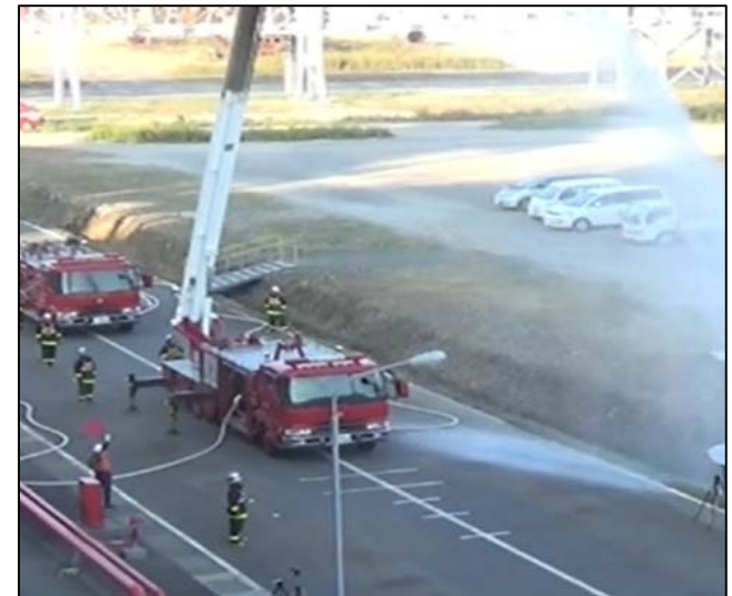
東ソー株式会社南陽事業所自衛防災組織 (昨年度の最優秀賞(総務大臣賞)受賞組織)