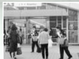
▲火災予防の啓発活動

消防団は、普段は自分の仕事に就きながら、『自分たちのまちは自分たちで守る』という精神に基づき、火災や風水害などの災害出動、災害予防広報・各種訓練などの防災活動を行い、地域の防火・防災リーダーとして幅広い活動を行っています。 草津市消防団は団本部(団長・副団長2人)と7つの分団で構成されており、約200人の団員が活躍しています。