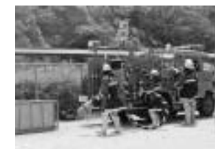
▲滋賀県総合防災訓練

家も近所で、気軽に引き受けてしまったというのが本当のところですが、制服の支給があり、任免式に出たときは大変緊張したのを覚えています。普段あまり経験のできない緊張感があり、自分も消防団の一員になるのだなと気の引き締まる思いでした。 入団してからは、各種訓練などに参加しました。防災広報活動では、初めて消防車に乗りました。水防訓練では、土の積みや杭打ち工法を教わりました。総合防災訓練では、自衛隊も参加する訓練規模の大きさにびっくりしました。いろいろな場面で消防団員の統率のとられた行動、規律正しさに驚かされます。分団の先輩方は指導も丁寧で、気さくに話ができる雰囲気です。同期入団の仲間がいるのも心強く、一緒に消防団活動、訓練に励んでいけると感じています。 まだまだ消防団員としての知識・経験が足りないため、先輩方の後をついて行くのが精いっぱいですが、今後も訓練を積み重ねて一人前の団員になれるようがんばっていきたいと思います。