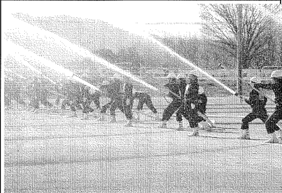
出初式にて放水を行う消防団員