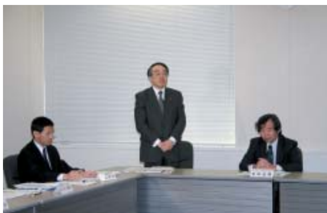
挨拶をする大石利雄消防庁次長