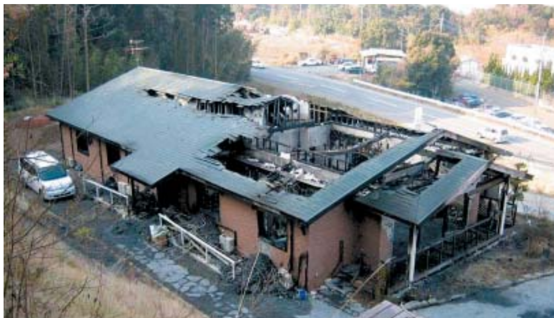
火災発生後の「やすらぎの里さくら館」の外観

平成18年1月8日4時23分に長崎県県央地域広域市町村圏組合消防本部から火災報告（第1報）を受け、直ち