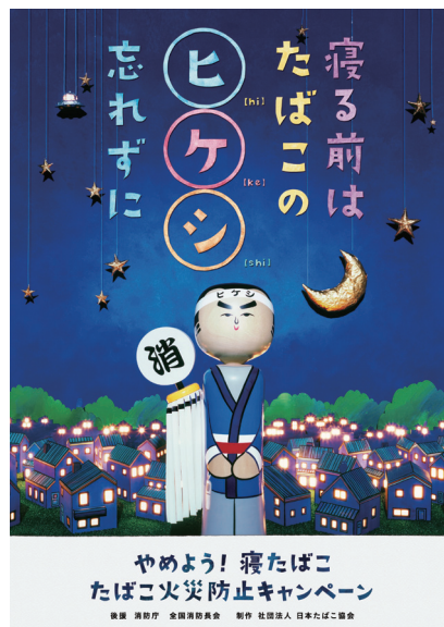
「たばこ火災防止キャンペーン」ポスター