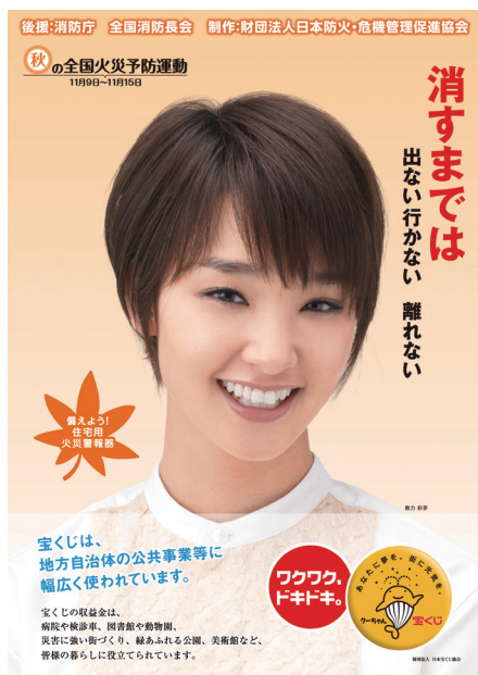
「平成24年秋季全国火災予防運動」ポスター

また、本年5月に発生した広島県福山市のホテル火災を踏まえ、関係部局と連携した消防法令違反の是正とあわせ、夜間を想定し施設の実情を踏まえた訓練の実施、避難経路や防火戸等の避難管理の徹底等により、ホテル・旅館等における防火安全対策を徹底していきます。