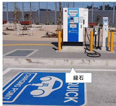
車道と急速充電設備との間に縁石を設けている事例

(注)本資料に掲載している写真は、鉄製パイプを設備の周囲に設置している事例であるが、この鉄製パイプは事業者が付加的に設けたものである。縁石や車止め等が設けられている場合には、急速充電設備への電気自動車等の衝突防止措置として、追加で鉄製パイプを設ける必要はないことに留意されたい。