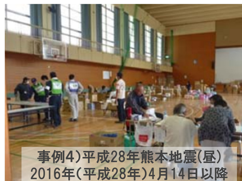
事例4)平成28年熊本地震(昼) 2016年(平成28年)4月14日以降