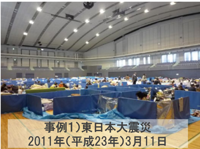
事例1)東日本大震災 2011年(平成23年)3月11日