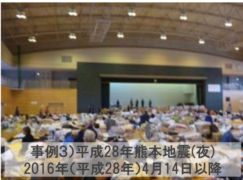
事例3)平成28年熊本地震(夜) 2016年(平成28年)4月14日以降