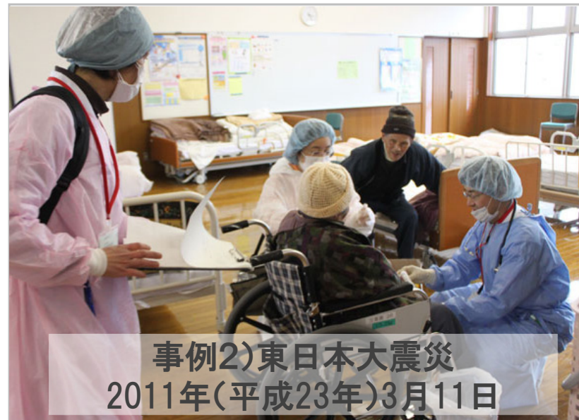
事例2)東日本大震災 2011年(平成23年)3月11日