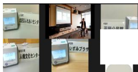
加古川市での実証の状況

この他、屋内受信機に設定された外国語（英、中（繁・簡）、韓）で、それぞれ音声鳴動、文字表示されることを確認。