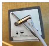
テレビ用コンセントへの接続状況