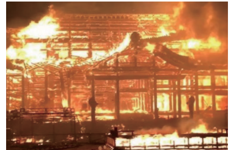
首里城火災