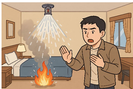
＜自動消火設備が作動しているイメージ＞