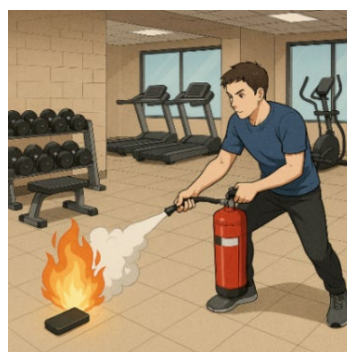
＜利用者による初期消火のイメージ＞