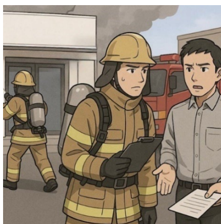
〈消防隊への情報提供のイメージ〉