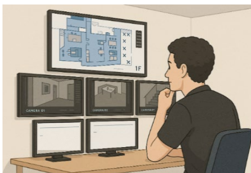
<遠隔監視のイメージ>

※4 自動火災報知設備と火災通報装置を連動させて通報することについては、消防機関により運用が異なる場合があるため、事前に管轄する消防機関と協議してください。