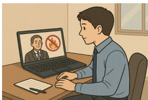
〈オンラインによる教育のイメージ〉