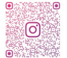
新潟市消防局広報動画

デジタルメディア消防広報戦略チームメンバーは20代から30代で構成され、動画制作の際には、若い感性からくる素晴らしいアイデアがあった。それらのアイデアは40代以上の職員が感じていた消防らしさや行政機関としての堅いイメージを崩すものであり、それを外部に広報として発信する組織の寛容さが求められた。