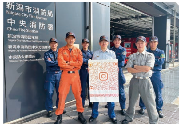
デジタルメディア消防広報戦略チーム

効果的な SNS 広報を行うため、主にInstagramを活用して消防広報を行うデジタルメディア消防広報戦略チームを発足し、従来とは異なる予防広報動画の制作を試みた。