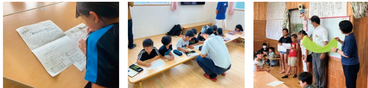
全2回開催されたワークショップの様子

野火太の開発にあたり「高齢者へメッセージ性の高いデザインにしたい」「児童の火災予防に対する関心を高めたい」という2つの思いから、令和6年夏、市内学童クラブ2施設を利用する児童を対象に「野火太のデザインを考えようワークショップ」と題して、花巻市では毎年、野火火災が多発していることを地域の課題として学習し、火災予防の願いを込めたデザインを考えてもらうワークショップを開催し、その応募デザイン案から3点を野火太のデザインとして採用した。