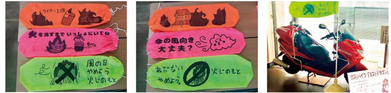
児童が考えたデザイン案から選ばれた野火太のデザイン