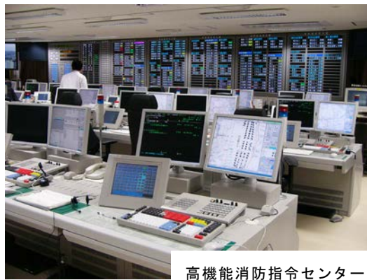
高機能消防指令センター