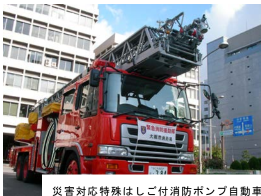
災害対応特殊はしご付消防ポンプ自動車