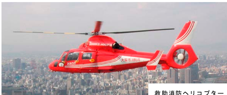
救助消防ヘリコプター