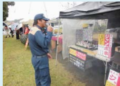
露店等への防火査察を実施