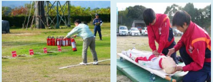
事業所を対象とした初期消火競技大会を開催