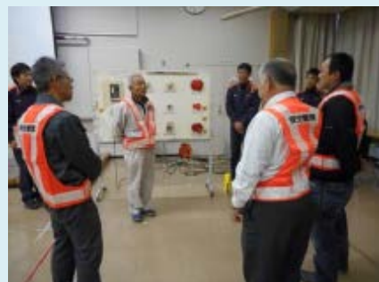
防火管理者が行う自主消防訓練のための講義を実施