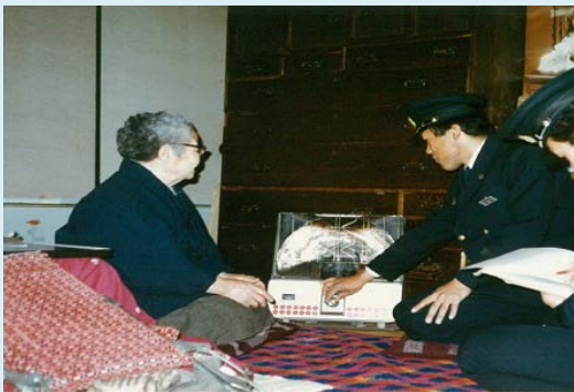
一人暮らし高齢者宅への防火訪問を実施