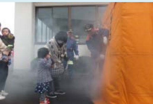
煙の中の避難体験や放水、救助体験などに参加できる「119消防広場」を開催