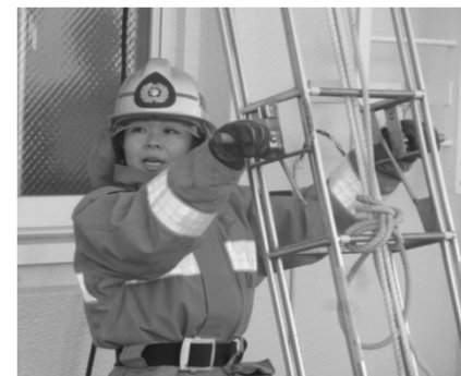
・警防科での訓練に取り組む女性消防職員