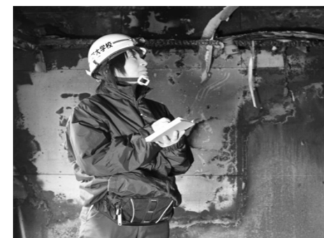
・火災調査科の実習に取り組む女性消防職員