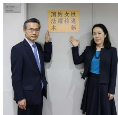
左：長官、右：消防・救急課長