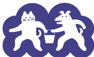
防災まちづくり大賞