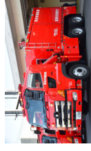
海水利用型消防水利システム(スーパーポンパー)