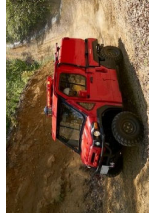
悪路走行可能な小型車両