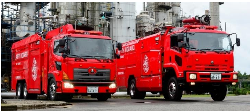
(ドラゴンハイパー・コマンドユニット)