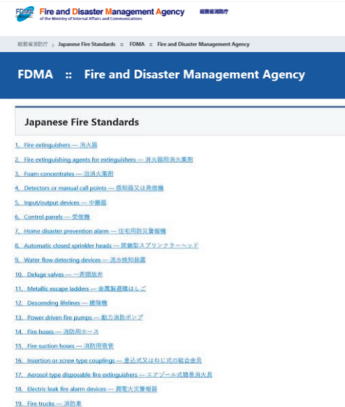
【規格省令一覧ページ】

イ 日本の消防用機器等の紹介リーフレットの作成 国際会議や消防防災展などのイベント、政府間協議等の場で日本の消防用機器等の優位性を PR でき