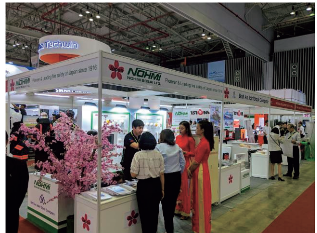
「Fire Safety & Rescue VIETNAM 2019」における日本ブース

（左より、ベトナム社会主義共和国公安省ヴオン副大臣、フック首相、日本国安倍総理大臣、総務省古賀政務官（当時））