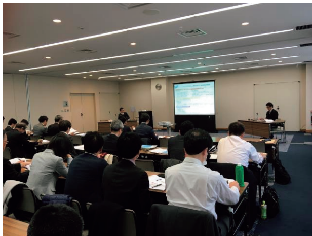
海外展開セミナーの様子