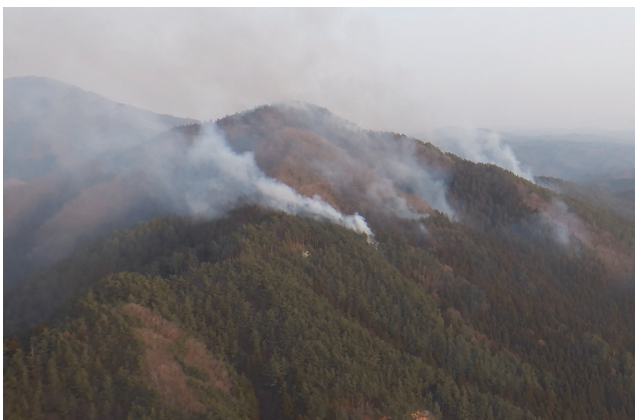
令和5年3月福島県郡山市で発生した林野火災

また、令和5年*1においては、3月に福島県郡山市で発生し113haを焼損した火災、5月に長野県茅野市で発生し166haを焼損した火災がある。