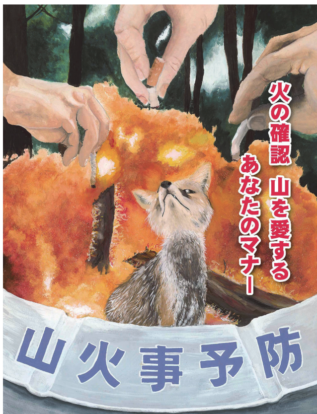
山火事予防ポスター

さらに、平成30年から林野火災の優良な予防対策の事例や実災害から得られた知見等を広めることを目的に、都道府県林野関係部局や消防本部等を対象とした「林野火災対策説明会」を開催している。