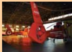
■ 表紙 東京消防庁航空隊 東京ヘリポート内ハンガー 「つばめ」消防ヘリ5 アエロスパシャル JA9980