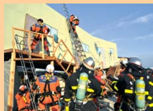
表紙 第4回緊急消防援助隊 全国合同訓練(愛知県知多市) 木造家屋倒壊事故救出訓練