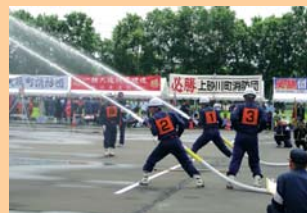
表紙 旭川市消防本部 平成22年度北海道 消防操法訓練大会における 旭川市消防団第28分団の ポンプ車操法