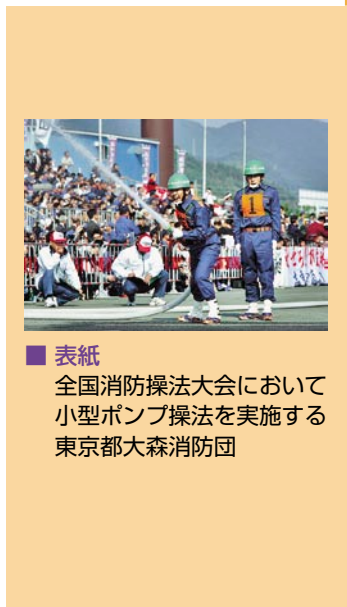
表紙 全国消防操法大会において 小型ポンプ操法を実施する 東京都大森消防団