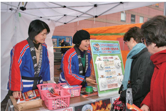
住宅用火災警報器設置推進活動（茨木市女性防火クラブ）

「自分たちの地域は自分たちで守る」という信念と連帯意識の下、火災や災害に強い安心安全なまちづくりのため、より多くの方々に婦人（女性）防火クラブ活動に積極的に参加していただきたいと思ひます。