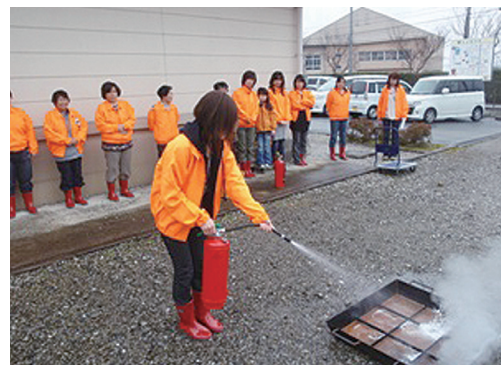
消火訓練（愛知郡女性防火クラブ連合会）