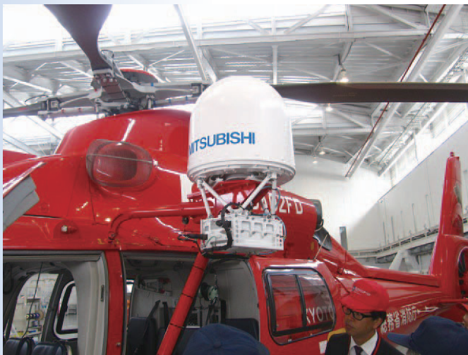
ヘリサットシステムのアンテナ