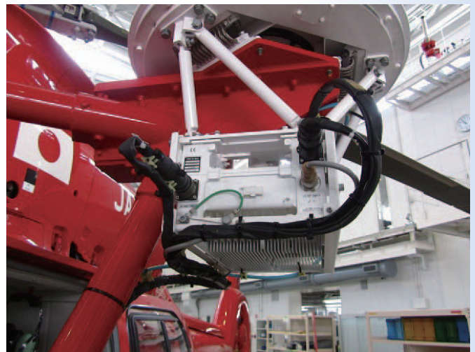
ヘリサットシステムの送信機