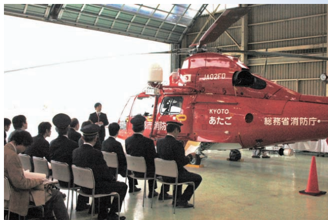
ヘリサットシステム引渡式の様子

旦、地上のヘリテレアンテナ設備で受けて通信衛星に中継していますが、アンテナ設備でカバーできない空白地帯が全国各地に存在しています。