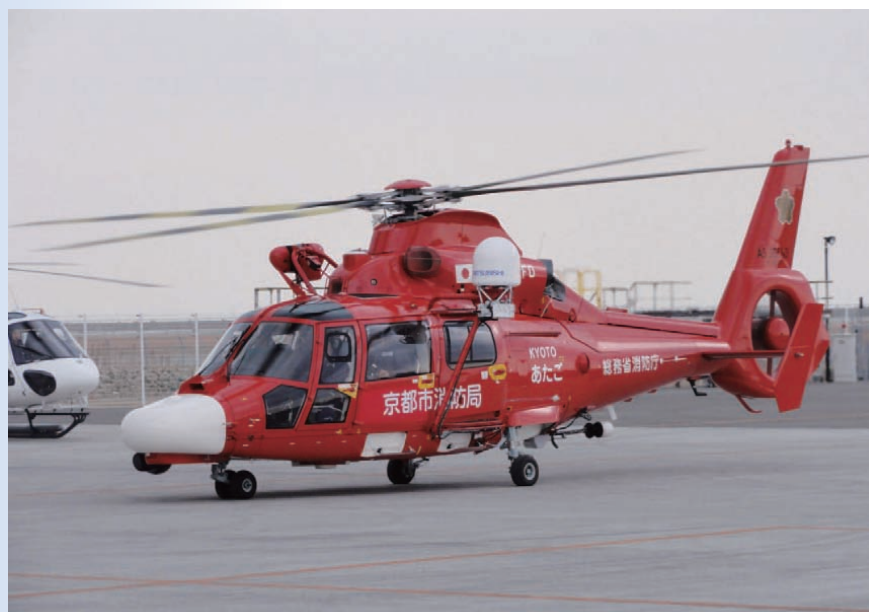
ヘリサットシステムを搭載した京都市消防局のヘリコプター（消防庁からの無償使用制度で配置しているヘリコプター）

消防庁が、緊急消防援助隊として無償使用制度で貸与及び貸与予定のヘリコプター（東京消防庁、埼玉県、宮城県、高知県（8月配備予定））に平成25年度内にヘリサットシステムを配備予定である。