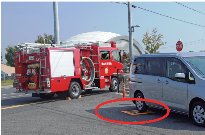
消火栓の上に車が止まっているため、消防自動車は消火栓を使用することができません。