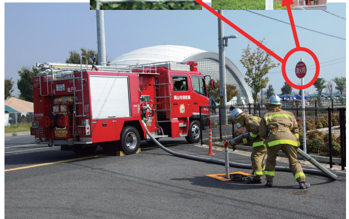
消火栓は、消防自動車が吸水しやすいように、道路脇や歩道上に設置されています。消火栓など、消防水利周辺への駐車はやめましょう。