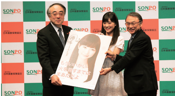
【ポスター贈呈の様子】

平成26年3月27日（木）、時事通信ホール（東京・銀座）において、全国統一防火標語及び防火ポスターの発表会が行われました。