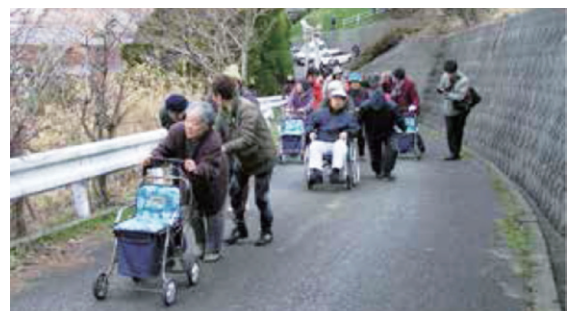
近所で声を掛け合うグループごとの避難状況