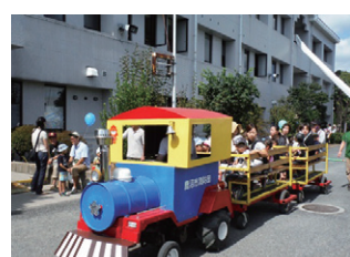
消防まつり汽車ぼっぼ