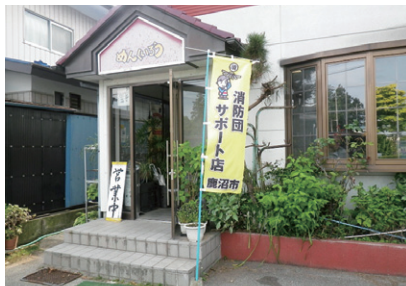
サポート店のぼり旗

本事業は、消防団員やその家族の福利厚生の上昇を図るとともに、地域全体で消防団の活動を応援し、理解を深めていただ