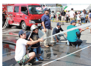
消防まつり放水体験