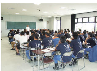
ビジョン消防団意見交換会