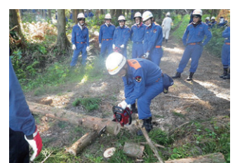
チェーンソー取扱研修会