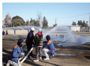
小学校避難訓練放水体験