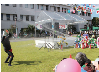
消防まつりご当地ヒーロー