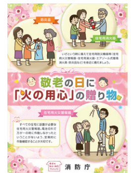
【キャンペーンポスター】

大好きな“おじいちゃん”や“おばあちゃん”が火災の被害に遭わないように、今年の「敬老の日」は、家の防火対策を考える「敬老の日」にしてみませんか?