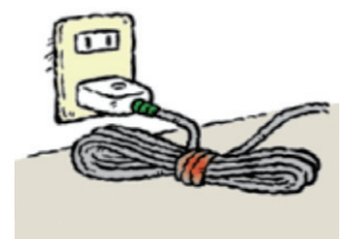
コードを束ねて使うのはやめましょう。