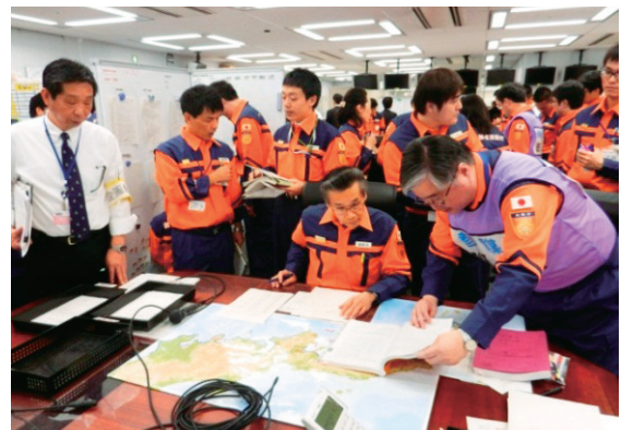
参謀班による被害状況の把握、方針の決定状況

応急対策室では、職員のさらなる災害対応能力向上と各班の業務の連携強化のために、定期的に図上訓練を実施し、災害発生時の対応に万全を期することとします。