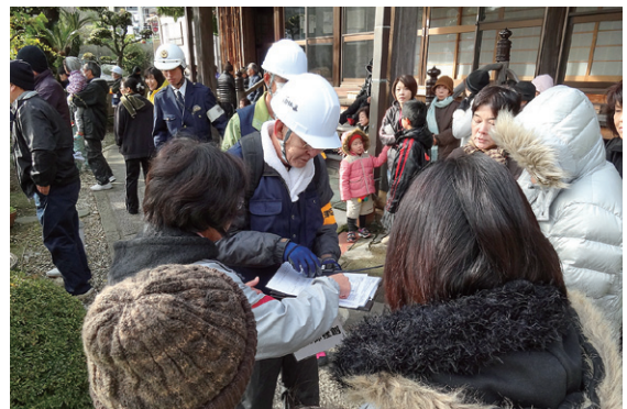
【安否確認訓練】避難後の防災委員による安否確認の様子

海南市塩津区防災会は、南海トラフ地震に備えるために結成された自主防災組織で、「自分たちでできることはすべてやる」を合言葉に避難訓練や安否確認訓練、避難所運営訓練等の各種訓練に自治会や消防団、学校等が一体となって取り組んでいます。