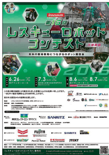
第16回レスキューロボットコンテストのポスター

消防庁では、自治体消防制度60周年の記念事業として第8回（平成20年）に初めて消防庁長官賞を設け、その後も継続して、先進的な科学技術の導入等により要救助者の負担軽減と効率的な救助を実現したチームに対して表彰を行い、今後の消防防災活動を支えるレスキューロボットの研究開発・実用化の推進に寄与しています。