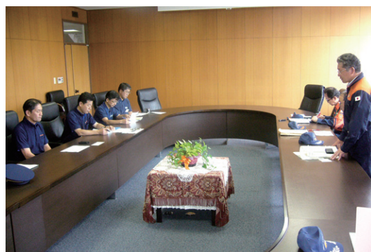
益城町役場で西原町長（左端）と意見交換を行う富樫総務大臣政務官（右端）