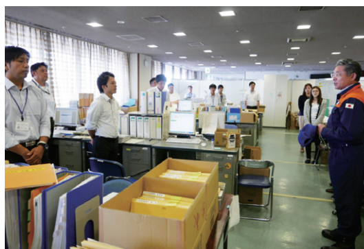
熊本市役所で応援職員の激励を行う富樫総務大臣政務官（右端）