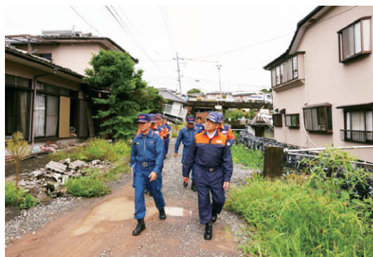
益城町内の災害発生現場を視察する富樫総務大臣政務官（右側手前）