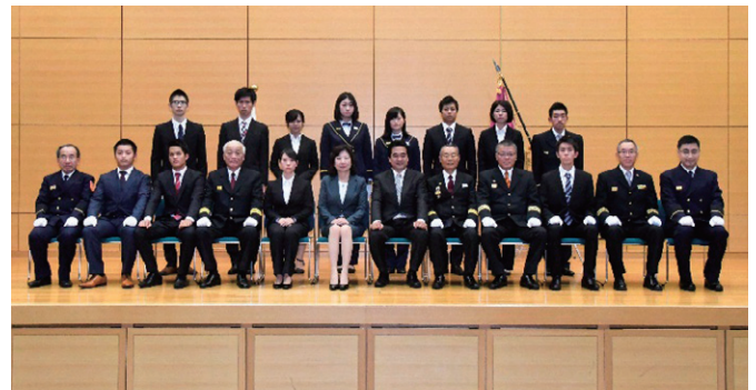
学生消防団員数増加団体