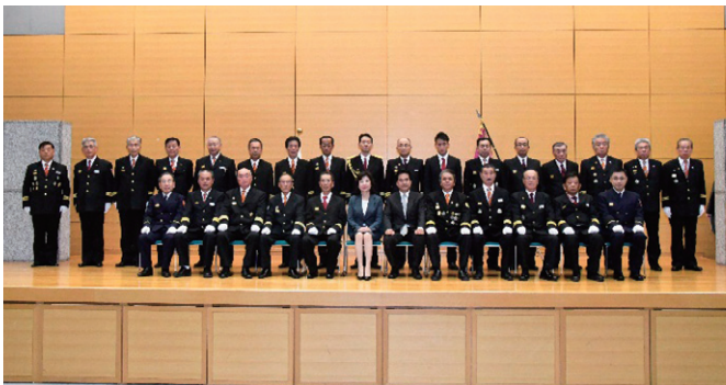
消防団員数増加団体