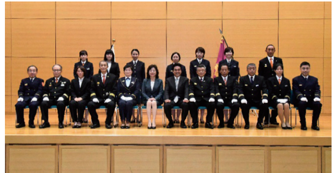
女性消防団員数増加団体