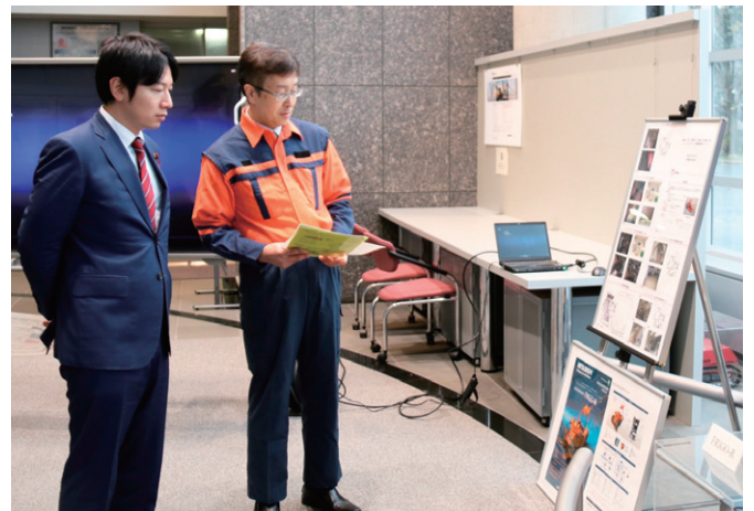
石油コンビナート等における大規模な火災等が発生し、消防隊員が現場に近づけない状況において災害の拡大抑制等を行う消防ロボットシステムについての説明を受ける小倉総務大臣政務官（左側）