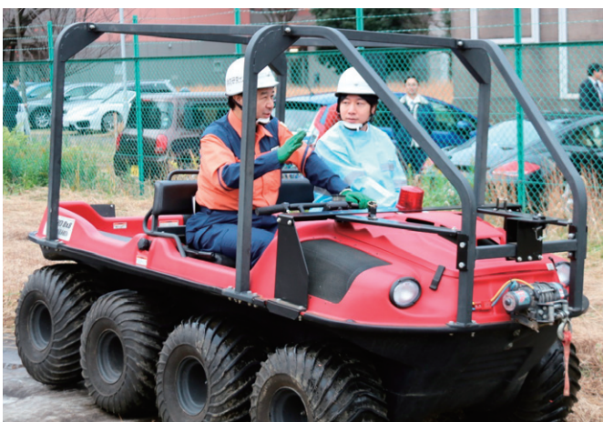
熊本地震等で活躍した、がれきや海水で立ち入りが困難な津波被害現場での消火・人命救助を行う水陸両用バギーについての説明を受ける小倉総務大臣政務官（右側）