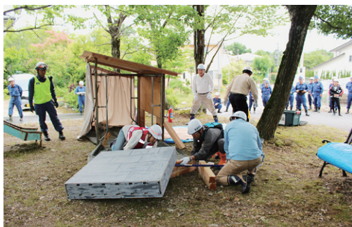
地域の防災訓練で行われたファーストコンタクト

大地震により倒壊家屋に要救助者がいることを想定し、駆けつけた住民が「二次災害は絶対に起こさない・起こさせない」という強い覚悟をチームとして持ち、危険排除・検索・重量物安定化など“安全管理の徹底”を図りながら活動する実災害をイメージできる内容としました。