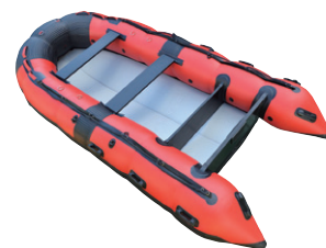
写真3 ウレタンボート