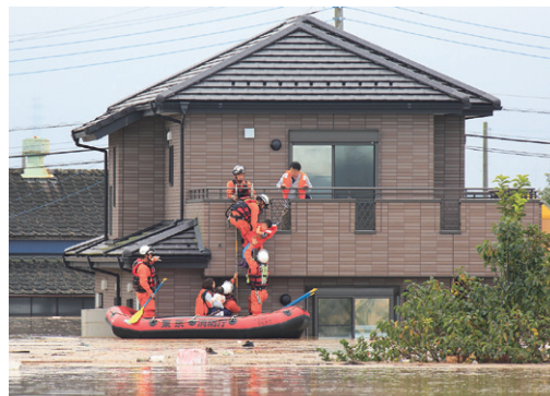
写真1 活動事例