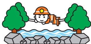
図1 救助手法の判断