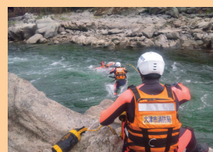
■表紙 大津市消防局 急流救助訓練(瀬田川)