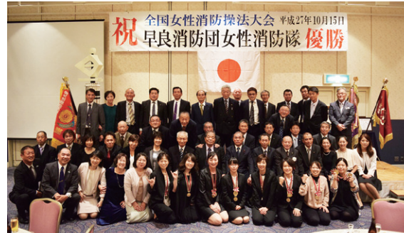
全国大会優勝報告会

い成績を残すことができました。その優勝の影には、団本部と各分団他数多くの方々からのご支援、そして家族からの協力があったことは言うまでもありません。