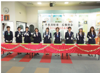
広報部会「チャイムズ」

予防・広報の活動では、地道な応急手当普及講習等の指導や高齢者宅への防火訪問活動に取り組む一方で、平成24年度には、ハンドベル演奏のチームとして「チャイムズ」を結成しました。チャイムズは、出初式や地域で開催される敬老会、クリスマス会で演奏するなど、その幅広い活動を通じて消防団のPRに大きく貢献しています。