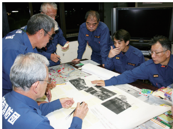
D I Gの様子

現在、各校区の地域防災力のさらなる強化を図るため、自治協議会の理解と協力を得ながら、消防団員によるD I Gを活用した地域住民への防災指導を積極的に行っています。