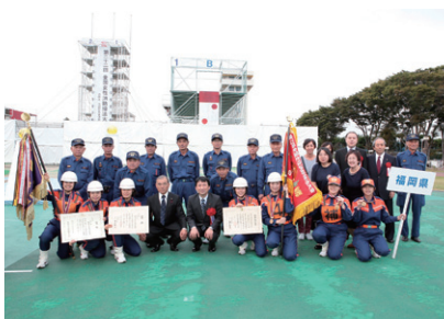
第22回全国女性消防操法大会

女性団員は、これまで予防・広報の活動に限られていましたが、平成25年度に第1回福岡県女性消防操法大会が開催され、この第1回大会を見学した団員からは非出場したいとの声があがりました。