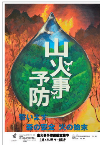
「全国山火事予防運動」ポスター：資料提供 林野庁