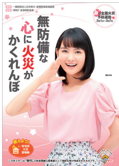
「平成28年春季全国火災予防運動」ポスター