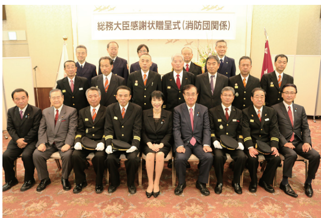
感謝状受賞団体 (一般消防団員増加団体)