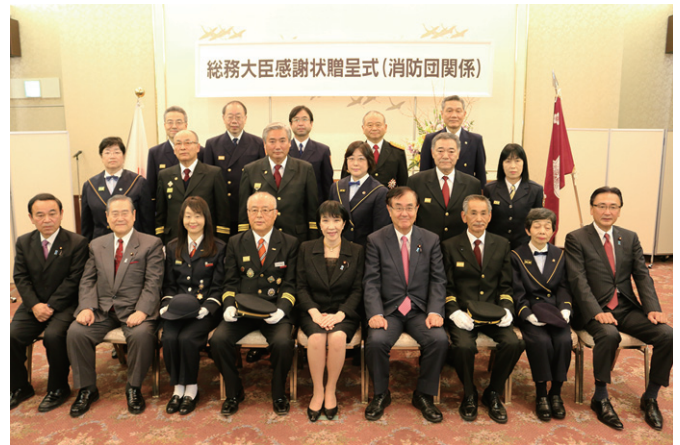
感謝状受賞団体 (女性消防団員増加団体)