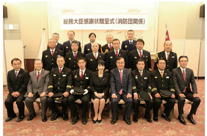
感謝状受賞団体 (熊本地震関係①)