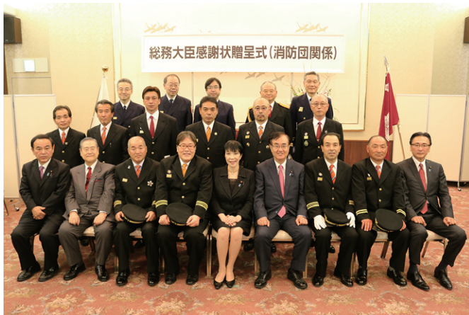
感謝状受賞団体 (熊本地震関係②)