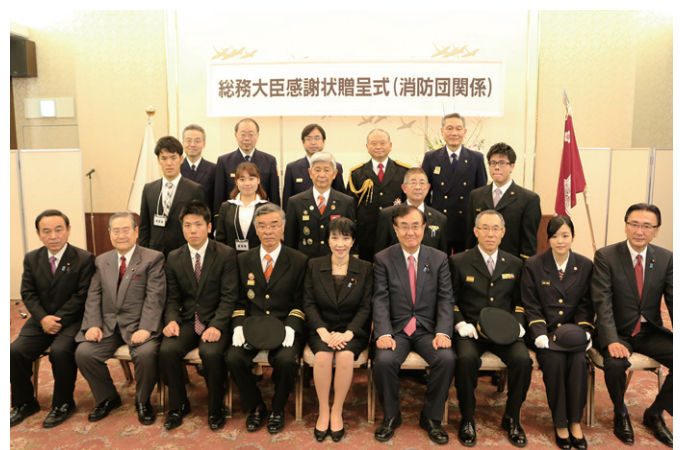
感謝状受賞団体 (学生消防団員増加団体)