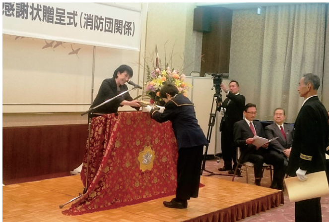
感謝状贈呈の様子