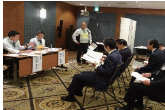
(平成30年度の研修の様子)